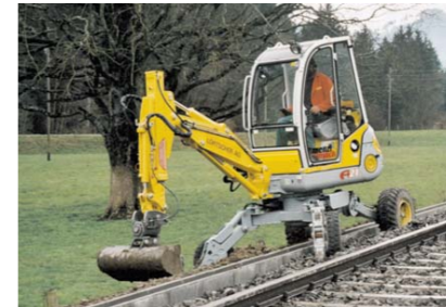
Curatare taluz de rambleu