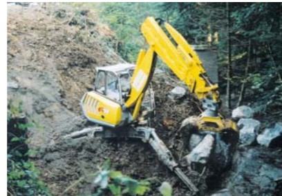
Schimbare curs torente