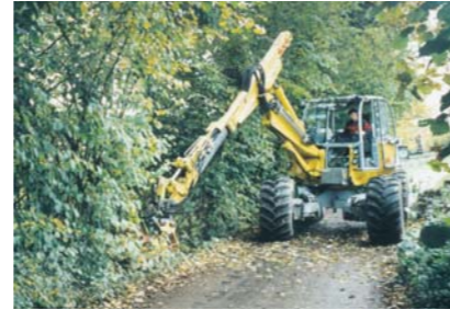
Amenajare drumuri forestiere