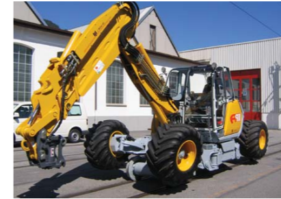
Versiune deplasare sine