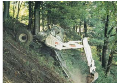
Constructii, amenajari in pante abrupte