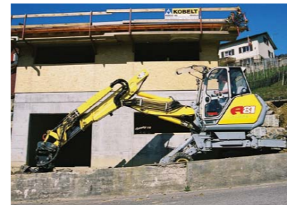
Operatiuni de umplere