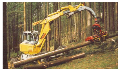
Diverse operatii administrative