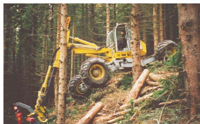
Exploatare forestiera in plan inclinat

conditii de teren. Costurile neobisnuit de reduse, performanta de top si investitii minime garanteaza succesul.