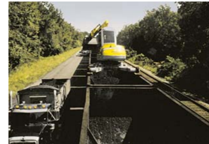
Constructii cai ferate