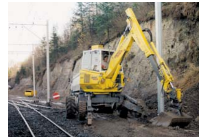
Intretinere cai ferate