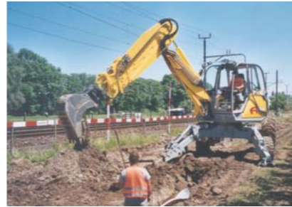
Introducere piloni in pamant