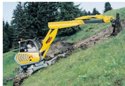
Drenare canale in pante