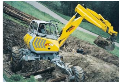
Pe pante abrupte