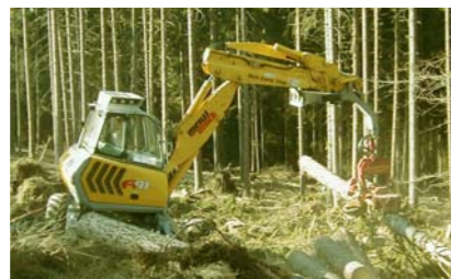
Adunare de reziduri lemnoase