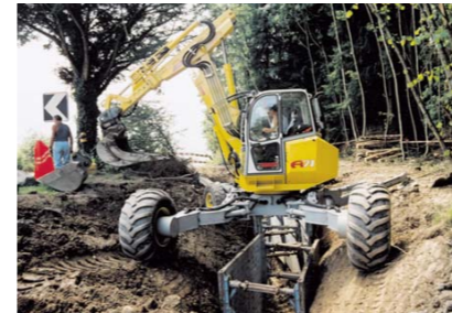
Lucru in santuri