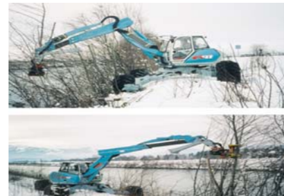
Indepartare colectare vegetatie