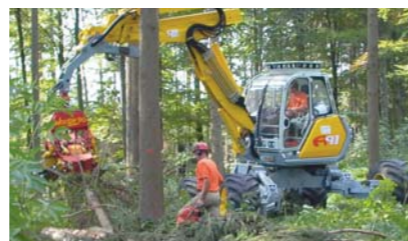
Operativitate in conditii extreme

BPI Consult SRL 507085 Harman Brasov / Romania