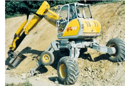
Cap mobil Powertilt