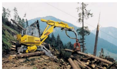
Dispozitiv special de manevrare