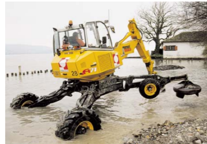
Pe mal cu gheare pentru