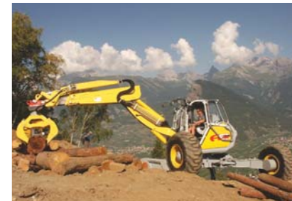
Diverse lucrari manevrare