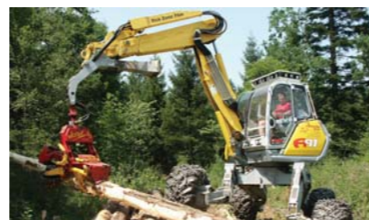
Functie de prindere pentru operatii