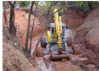
In mlastinile din Florida