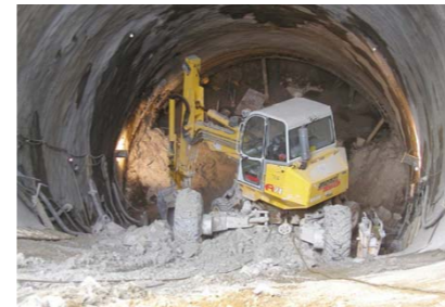
Lucrari in tunel