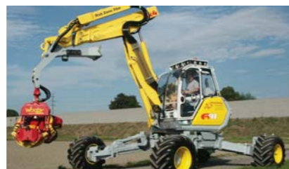
Tractiune integrala performanta