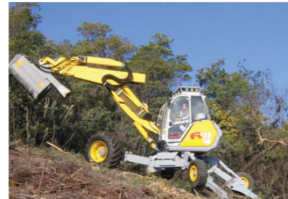
Lucrari de curatare