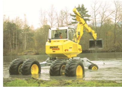
In ape adanci