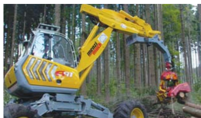
Doboara copaci, curata de ramuri si taie busteni la lungime