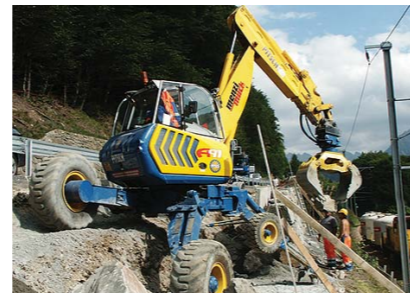
Constructii pereti de protectie din piatra