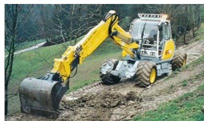
Construire si intretinere drumuri forestiere