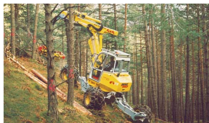
Curatare / rarire padure